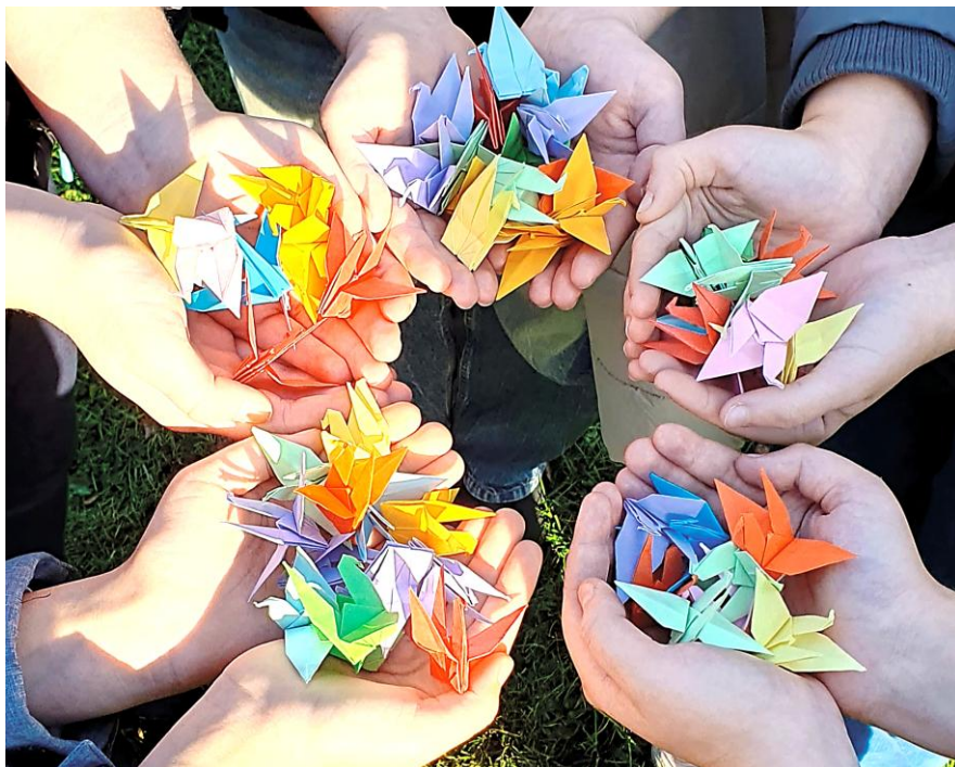
Kraniche der Hoffnung